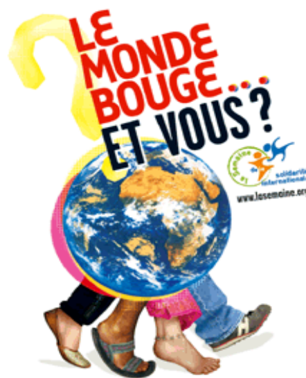
Affiche nationale de la Semaine de la Solidarité 2007