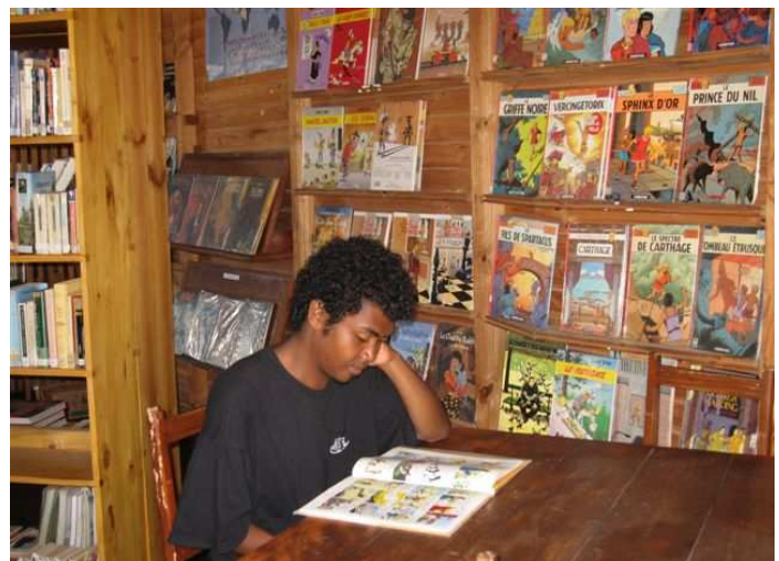
Centre de documentation de l'Alliance Française de Manangary

L'école primaire Victor Hugo à Notre-Dame-de-Bondeville, le collège Chartier à Darnétal, bientôt peut-être le collège Gounod de Canteleu... Les demandes affluent pour solliciter une intervention auprès des enfants... Nous souhaitons accentuer ces actions, n'hésitez pas à nous contacter!