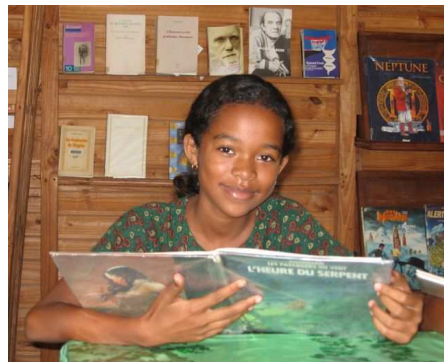
Centre de documentation de l'Alliance Française de Manangary

des adultes, des adolescents et des enfants. en effet, elles accueillent plus de 650 000 lecteurs et enregistrent 300 000 prêts par an.